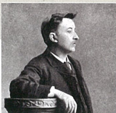
ラフカディオ・ハーン